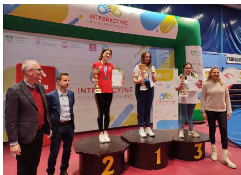
Na podium.