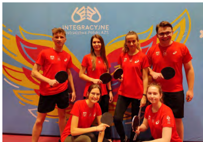
Reprezentacja PŁ podczas IMP w tenisie stołowym.

PIOTR: Tak, zdecydowanie. Uważam, że jest to świetna okazja nie tylko to współzawodnictwa, lecz także integracji (jak sama nazwa wskazuje). Oprócz