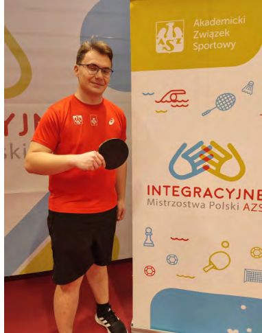
Piotr Pietrzak. Z archiwum autorki