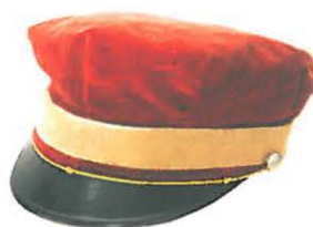
Wzór czapki studenckiej Politechniki Łódzkiej