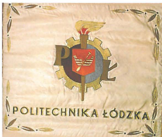
Sztandar – strona 1