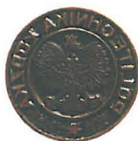
Pieczęć Politechniki Łódzkiej

W sprawach związanych ze stosowaniem znaku PŁ decyduje Rektor.