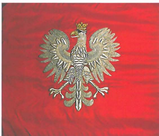
Sztandar – strona 2