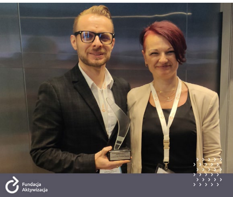
Dyrektorka Oddziału i pracodawca Boekestijn Transport Service

Covid-19 spowodowała, że zaczęłam szukać zatrudnienia w Polsce.