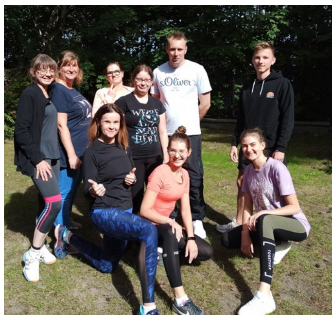
Pracownicy BON przyłączyli się do zajęć sportowych