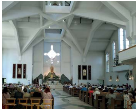
Ryc. 8, 9. Kraków os. Kalinowe, kościół pw. św. Józefa (proj. Jan Kurek i Zofia Łuczyńska) – próba godzenia pierwiastków tradycyjnych i współczesnych