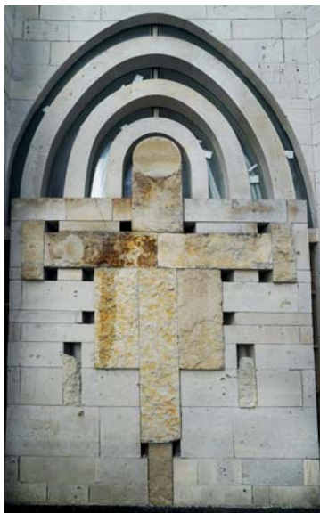
Ryc. 2. Tychy, kościół pw. św. Franciszka, rzeźbiarski detal zaprojektowany przez Stanisława Niemczyka