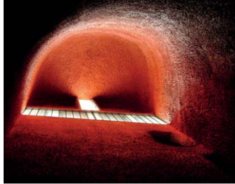
Ryc. 6, 7. Ronchamp, kaplica Notre Dame du Haut – pełna rzeźbiarskiej ekspresji żelbetonowa wizja świątyni wg. proj. Le Corbusiera (Charlesa-Edouarda Jeanneret-Gris) Fot. autora 2005.