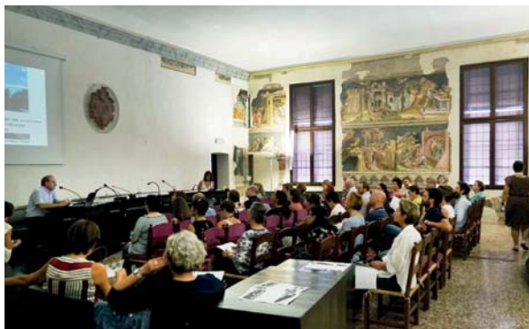
Ryc. 14. Padwa, aula – średniowieczna przestrzeń usakralniona – „świątynia nauki”