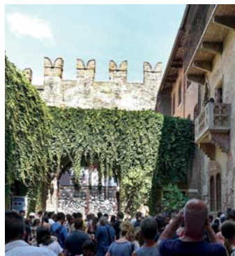
Ryc. 15. Verona, dziedziniec tzw. domu Julii – „świątynia” i natchnienie pokoleń zakochanych