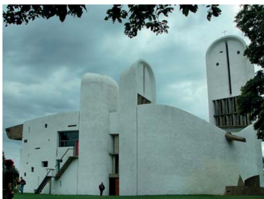
Ryc. 5. Ronchamp, kaplica Notre Dame du Haut – pełna rzeźbiarskiej ekspresji żelbetonowa wizja świątyni wg. proj. Le Corbusiera (Charlesa-Edouarda Jeanneret-Gris)