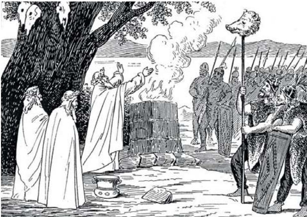
Ryc. 1. XIX – wieczne wyobrażenie pogańskich obrzędów kultowych pod „świętym dębem” – świątynią i sacrum jest tu sama Natura

W architekturze sacrum odczuwamy jako harmonię form – tak na zewnątrz jak i w uformowaniu wnętrza i detalu, podporządkowanego sakralnym wymiarom całości (świątyni). Chrześcijaństwo odrzuciło helleńską – kosmiczną wizję świata, wprowadzając jego antropocentryczne widzenie, a człowiek skupił się na sobie samym. Kult wczesnego chrześcijaństwa nie potrzebował budynku do sprawowania liturgii – można ją było odprawiać wszędzie. Z upływem czasu środkiem zbliżającym do sfery sacrum stały się plastyka i muzyka, a w plastyce – formy i detal architektoniczny. Kształtowała się świątynna religijność publiczna oraz religijność indywidualna prywatnych – domowych i podróżnych kapliczek. Poganin modlił się kiedyś przed świątynią, zaś chrześcijanin oddawał Bogu cześć w jej wnętrzu – co powodowało coraz większy udział sztuk plastycznych w budowie świątyni i wieloznaczeniowej „budowie” sacrum.