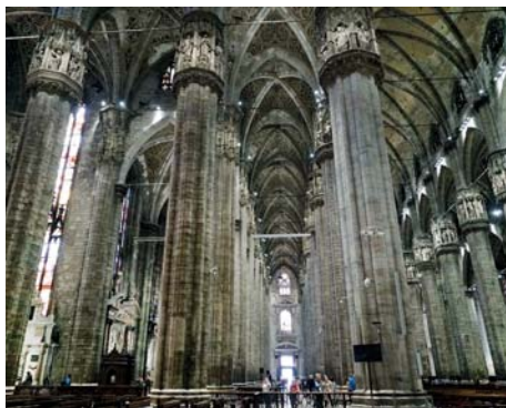
Ryc. 12. Mediolan, katedra – symbol monumentalizmu i boskiej mocy