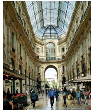
Ryc. 10. Bergamo, monumentalna architektura miejskiego placu to swoista katedra bez sklepienia