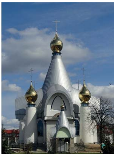
Ryc. 4. Białymstok, rzeźbiarska bryła cerkwi pw. św. Jerzego – proj. Jerzy Uścińowicz [7]