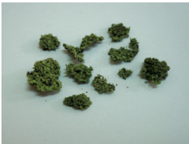
Zdjęcie 1. Wyszuszona próbka Hypogymnia physodes

Celem pracy była ocena korelacji ^{210}\text{Pb} i ^{210}\text{Po} w strukturach morfologicznych mchów i porostu. Biorąc pod uwagę dostępność i różnorodność gatunkową do oceny stężenia tych radionuklidów wybrano mchy Pleurozium schreberi , Polytrichum commune i porost Hypogymnia physodes .