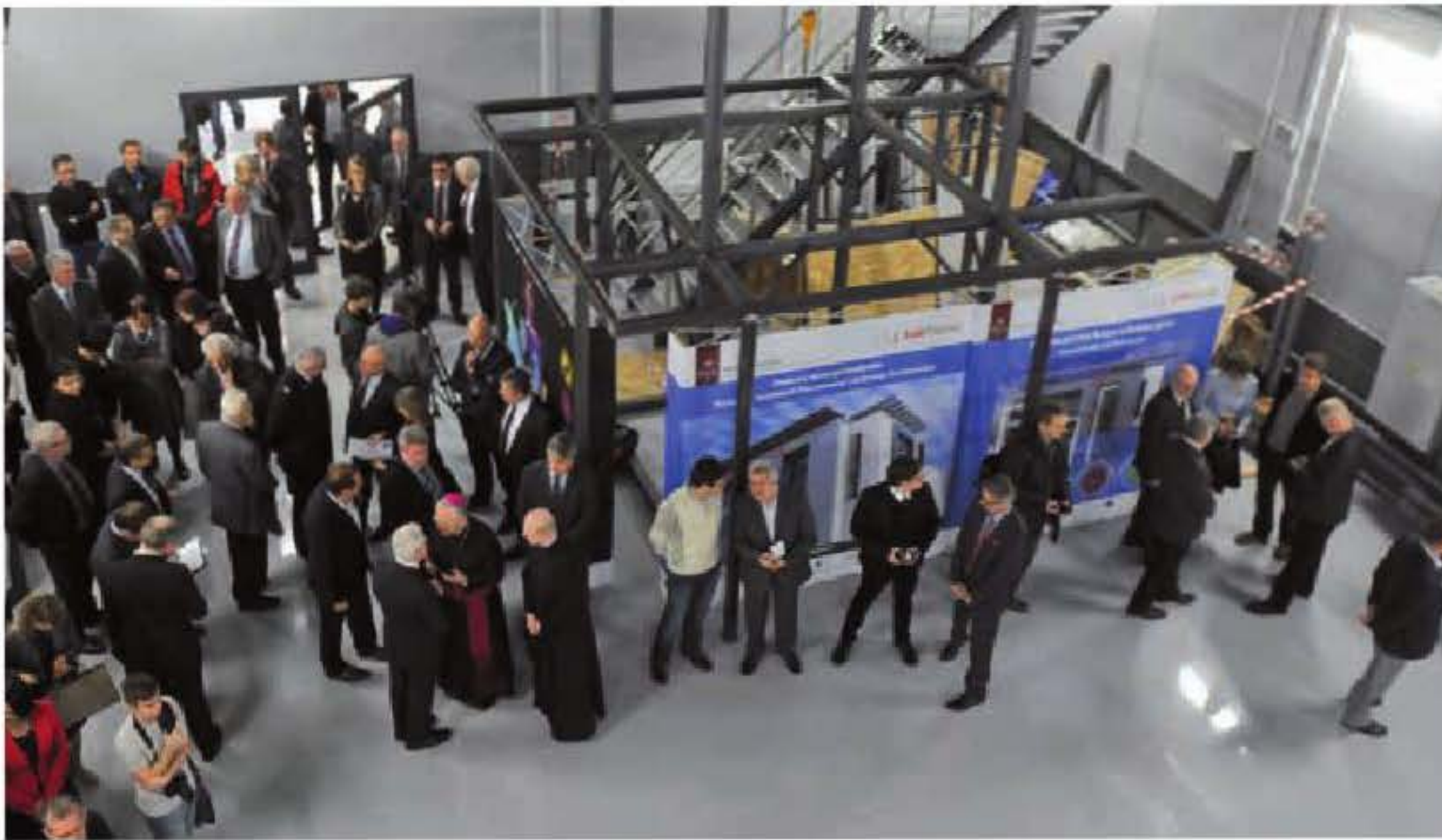
Hala technologiczna LabFactora zapelniła się gośćmi