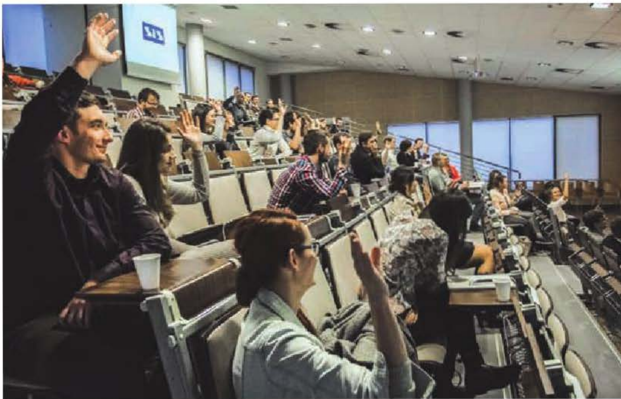
Prelekcjom towarzyszyła inspirująca dyskusja

Każdej prelekcji towarzyszyła inspirująca dyskusja, podczas której uczestnicy chętnie zadawali różne pytania. Niektóre wystąpienia cieszyły się tak dużym zainteresowaniem, że rozmowy z nimi związane przenosiły się w kuluary.