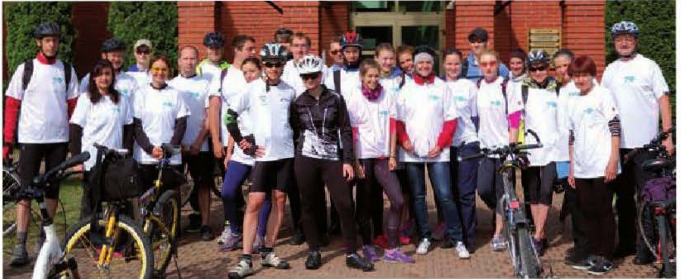
Uczestnicy rajdu 70 km na 70-lecie PŁ