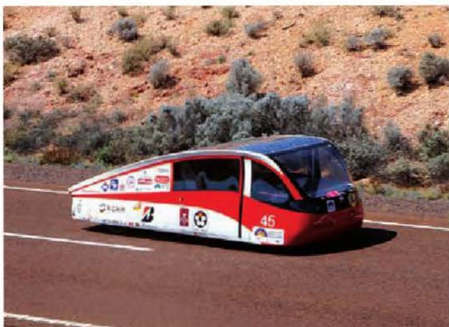
Bolid Eagle 1 przemierzający australijską pustynię