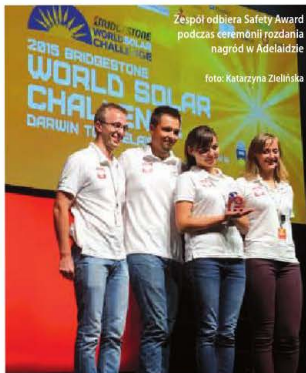
Zespół odbiera Safety Award podczas ceremonii rozdania nagród w Adelaide