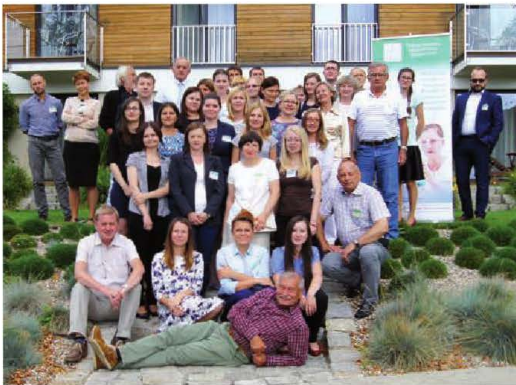
Uczestnicy konferencji w Uniejowie

Ogólnokrajowa Konferencja Naukowa „Postępy Inżynierii Bioreaktorowej” odbyła się już po raz dwunasty. Jest organizowana od 1983 roku przez Katedrę Inżynierii Bioprosesowej Wydziału Inżynierii Procesowej i Ochrony Środowiska PŁ pod patronatem Komitetu Inżynierii Chemicznej PAN. Nieprzerwanie jest miejscem, w którym specjaliści z zakresu inżynierii bioreaktorowej mogą wymienić się najnowszymi osiągnięciami w prowadzonych przez nich badaniach.