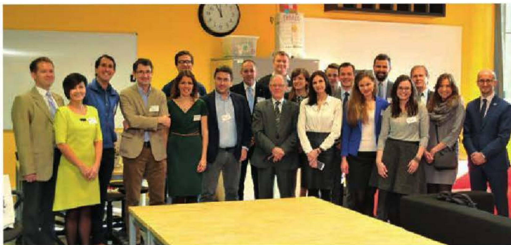
Uczestnicy Forum w pracowni DT4U

Innowacyjnie, kreatywnie, twórczo, a przede wszystkim konstruktywnie i pomysłowo. Tak było w pierwszym tygodniu listopada w Fabryce Inżynierów XXI w.