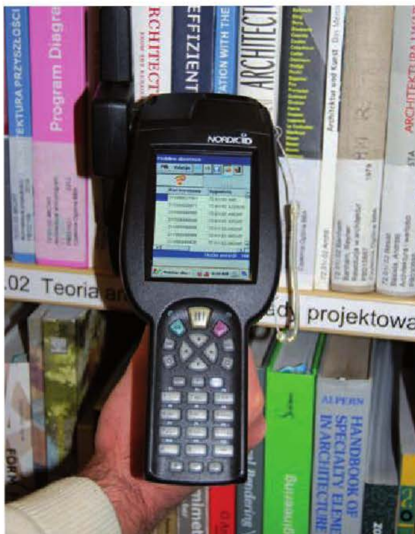
Odczyt etykiet za pomocą komputera mobilnego

Zainstalowane oprogramowanie zawiera tryb odczytu, tryb porządkowania oraz tryb wyszukiwania. Dzięki temu możliwe jest sporządzanie spisu woluminów z autoposji, porządkowanie zbiorów oraz sprawdzanie ich kompletności na półkach. Poza tym można odszukać stojące w innym dziale „zaginione” pozycje książkowe. Służy też do