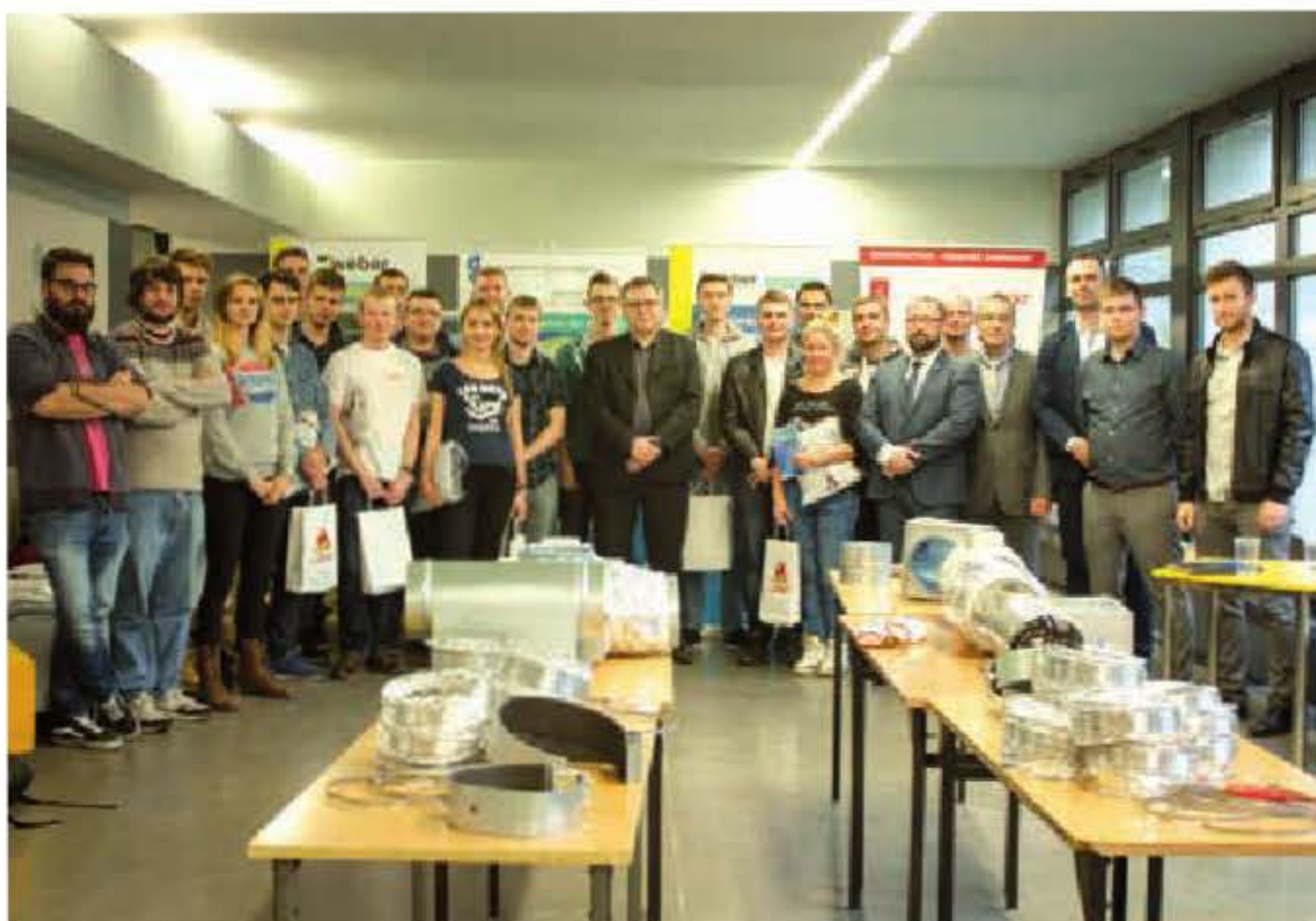
Uczestnicy trzeciej edycji konkursu wraz z opiekunami