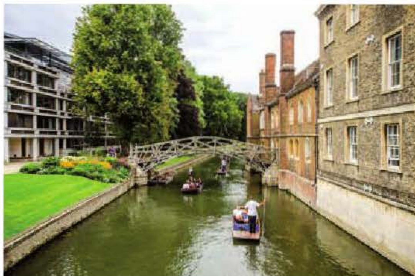
Most matematyczny – związane z nim legendy doskonale oddają nastrój Cambridge