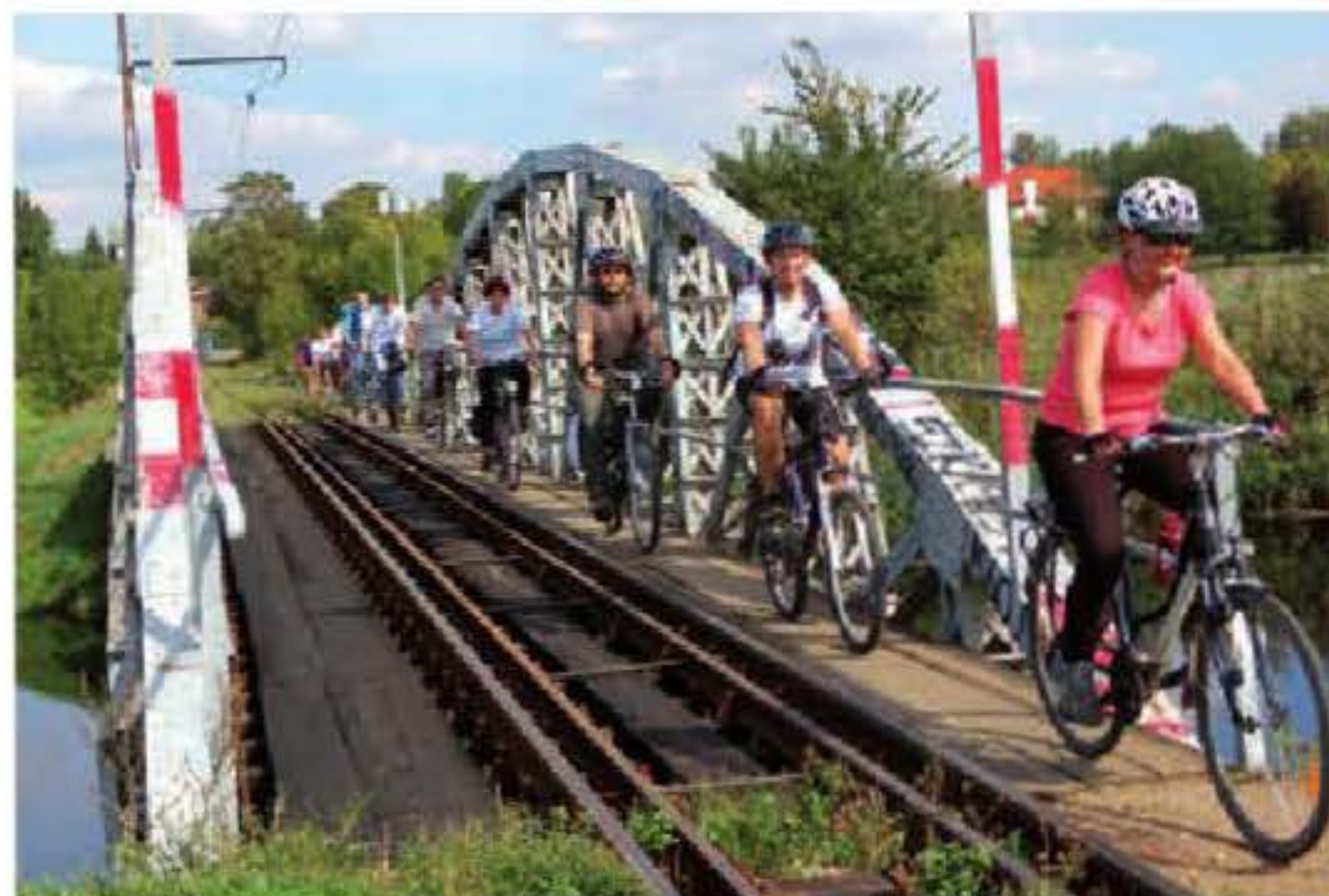
Przejazd przez jedyny w Europie most tramwajowy