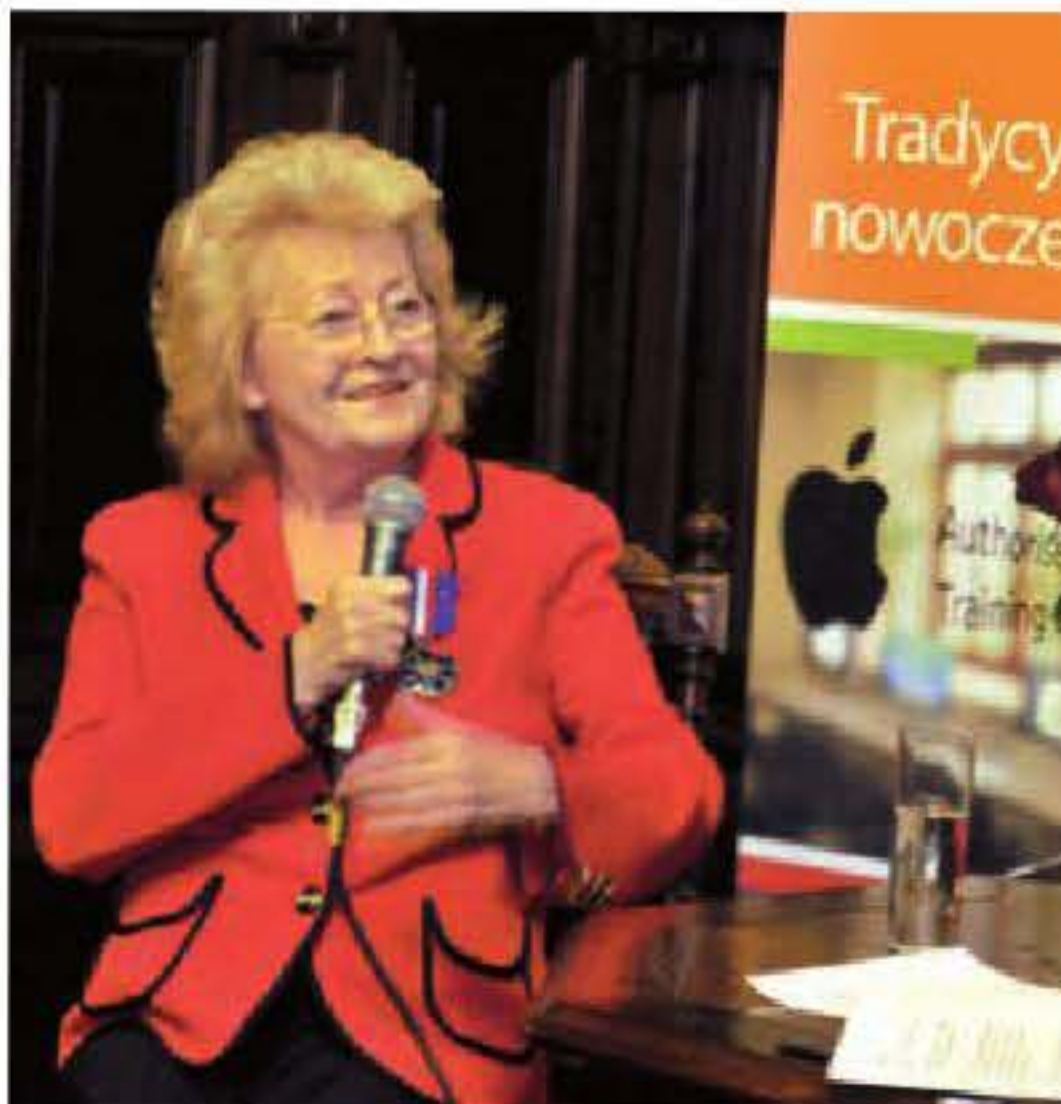
Stenia Kozłowska, gwiazda polskiej piosenki

Stenia Kozłowska występowała w wielu popularnych i lubianych programach takich jak: „Podwieczorek przy mikrofonie”, „Zgaduj Zgadula”, czy w kabarecie „Pod papugami”. Brała także udział w festiwalu opolskim, gdzie zdobyła złoty mikrofon.