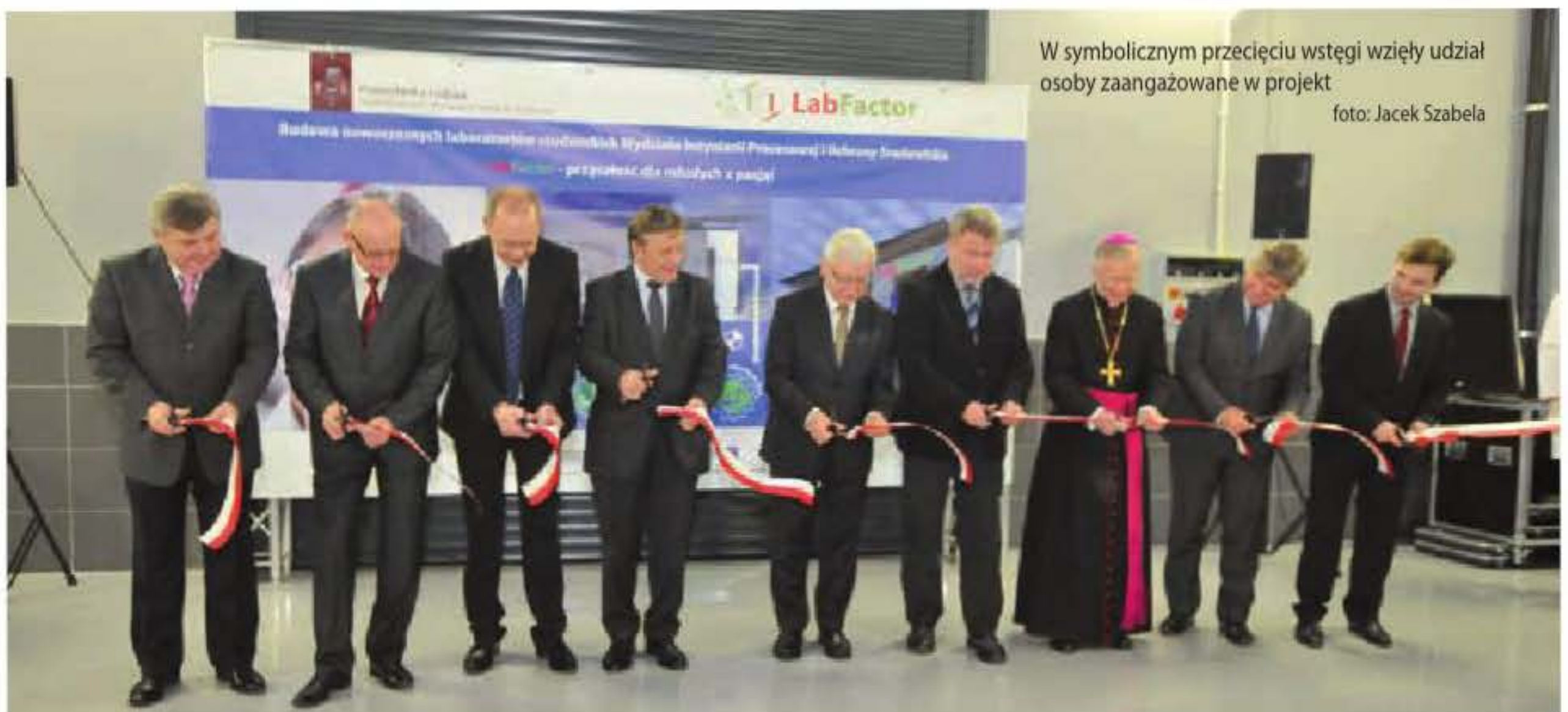
W symbolicznym przecięciu wstęgi wzięły udział osoby zaangażowane w projekt