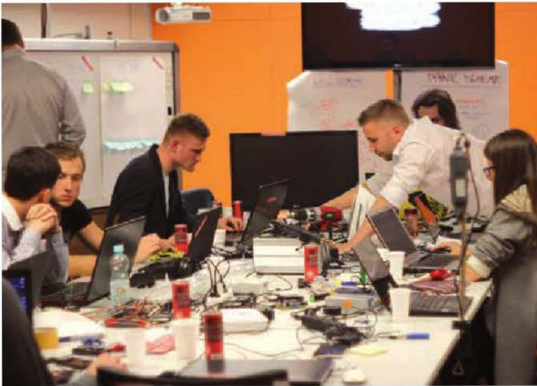
Tak wygląda Dev's Kitchen