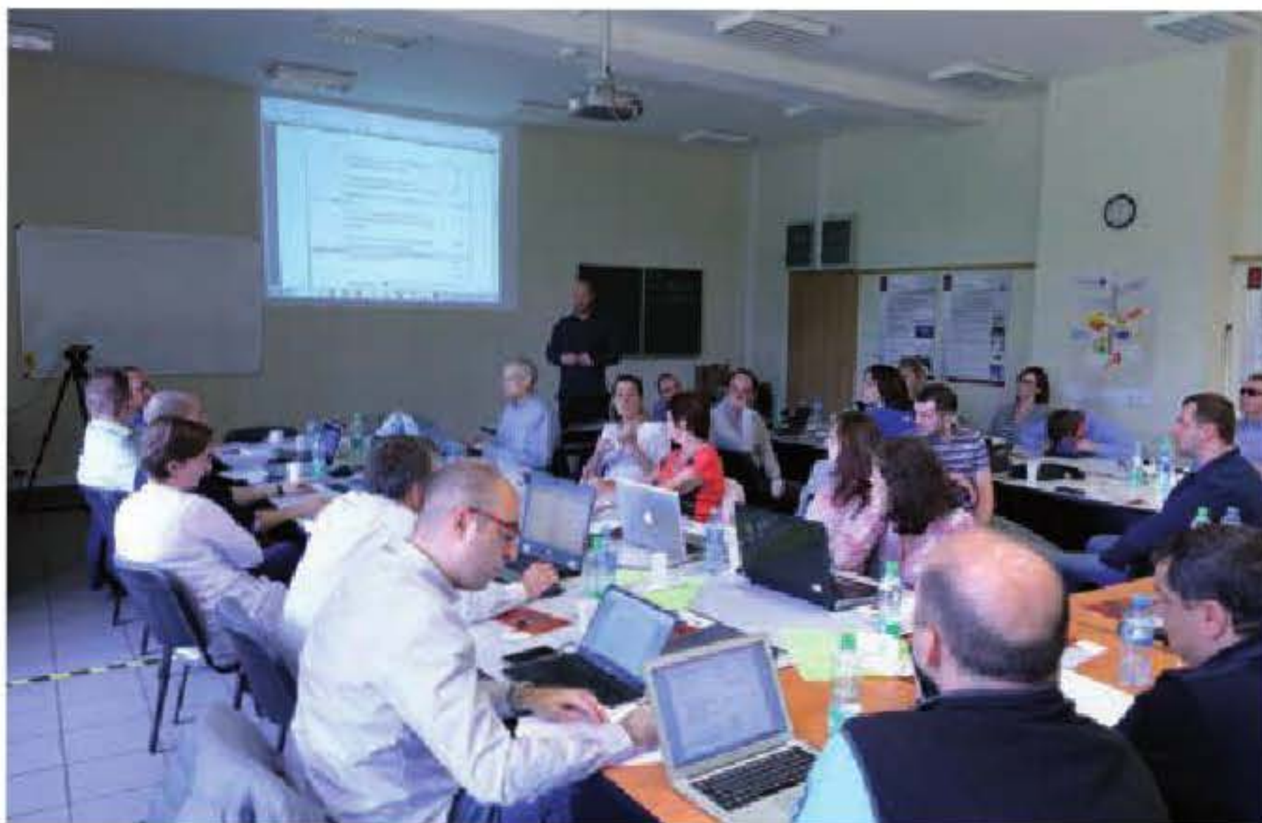
Dyskusje o projekcie Sound of Vision w PŁ