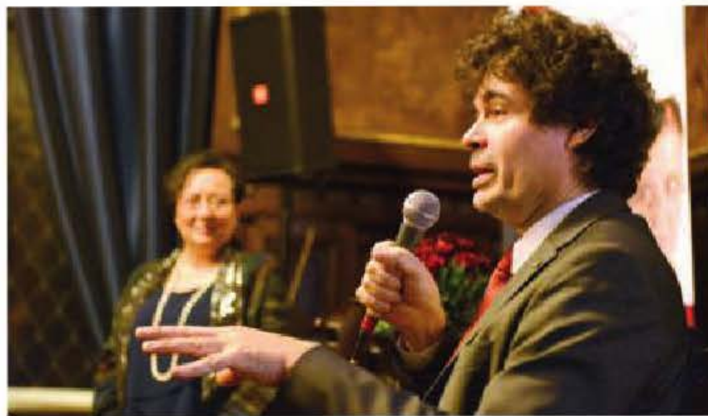
Warsław Kunc, znany polski dyrygent