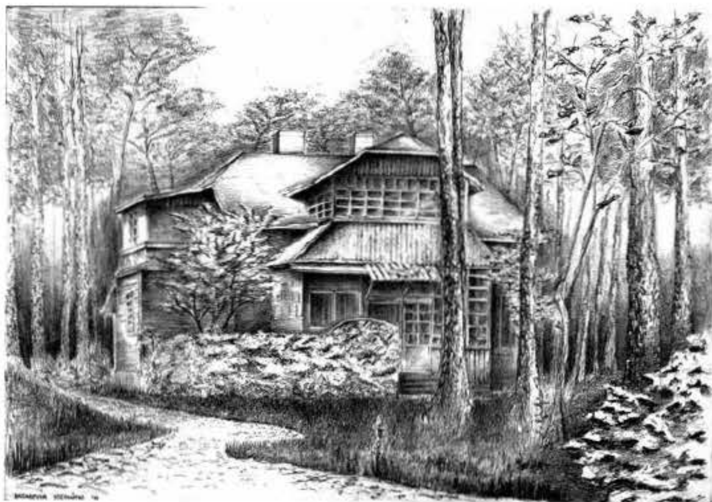
Dawna willa letniskowa przy ul. Toruńskiej 9, jeden z najstarszych budynków w Kolumnie.