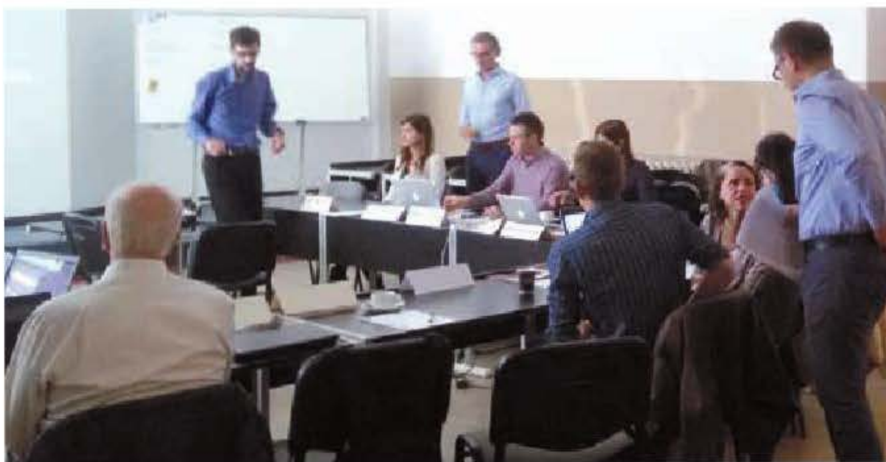
Spotkanie konsorcjum projektu BIP-UPy

Nowym obiecującym podejściem do regeneracji uszkodzonych tkanek jest inżynieria tkankowa in situ . W miejsce dysfunkcyjnej tkanki zostaje wszczepiony implant, który indukując pożądane reakcje organizmu powoduje odbudowywanie tkanki bezpośrednio w organizmie pacjenta.