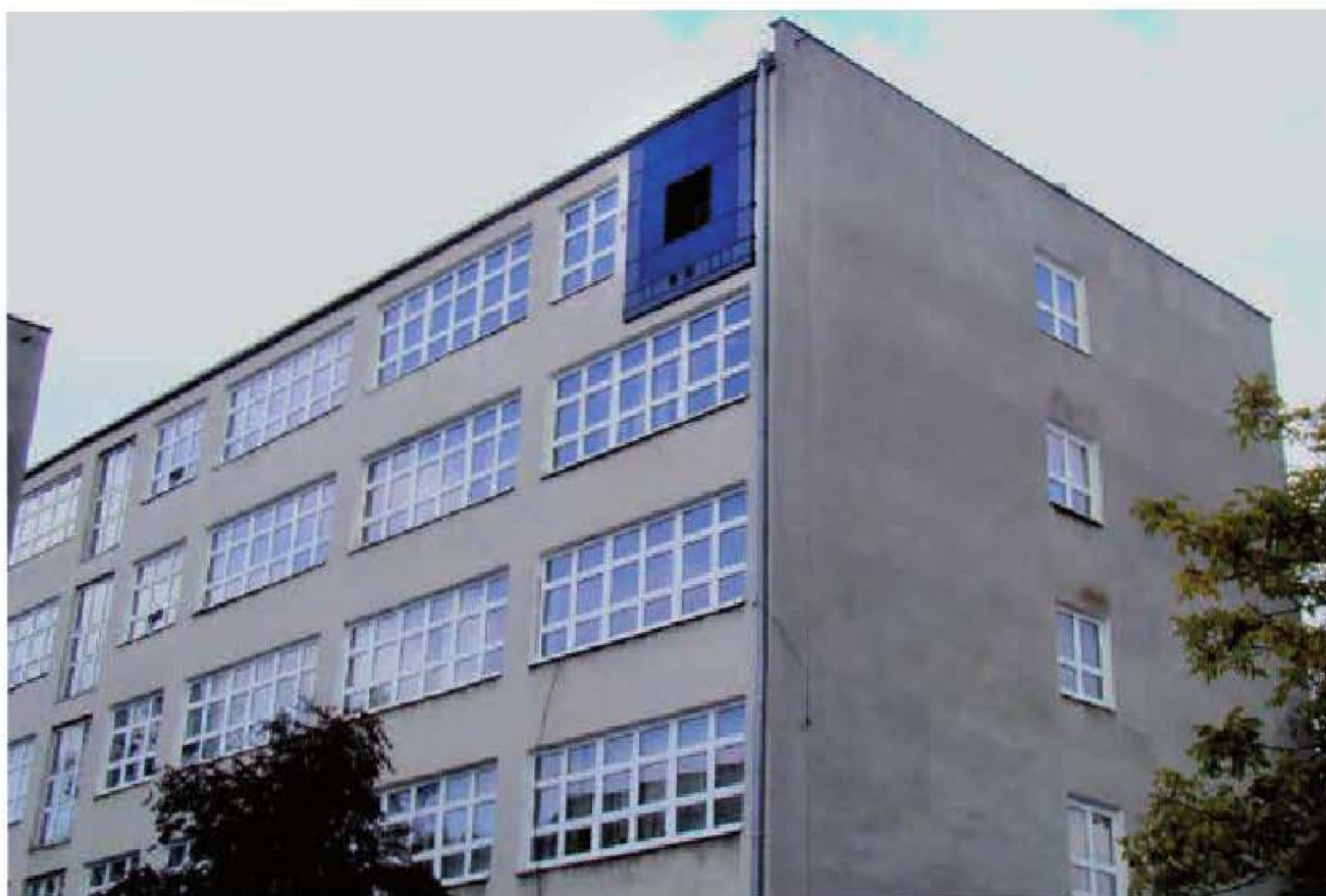
Eksperymentalna fasada znajduje się na czwartym piętrze budynku WIPOŚ