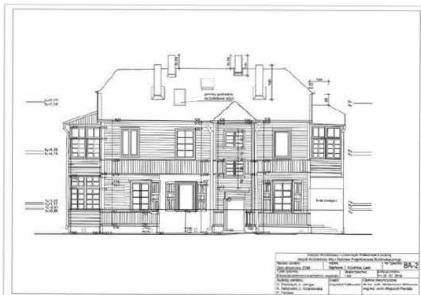
Elewacja północno-wschodnia budynku przy ul. Sejmowej 7

2014 roku studenci pod okiem opiekunów dokonali pomiarów czterech z siedmiu zaproponowanych przez Stowarzyszenie budynków komunalnych. Na ich podstawie sporządzono dokumentację, która jest podstawą do jakichkolwiek dalszych działań technicznych, w tym przypadku – miejmy nadzieję – związanych z przyszłym projektem rewitalizacji.