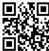
Fot. 4. Link do platformy edukacyjnej Politechniki Łódzkiej. Fotografia z plakatu promującego WIKAMP Źródło: Wirtualny Kampus Politechniki Łódzkiej ( http://edu.p.lodz.pl ).