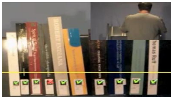
Fot. 1. Działanie aplikacji ShelvAR