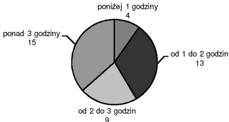
Rys. 1. Dzienny czas wolny do dyspozycji studentów

W zakresie spędzania wolnego czasu, 38 badanych często korzysta z Internetu, 24 badanych sporadycznie zajmują się sportem i turystyką, a 27 badanych nigdy nie modeluje i konstruuje.