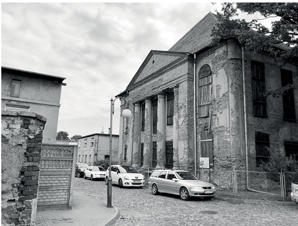
Ryc. 3. Synagoga w Kępnie

Frontowa elewacja zachodnia wypełniona była ryzalitem zwieńczonym frontonem, umieszczonym na fryzie i architrawie. Całość opierała się na dwóch antach i czterech przyściennych kolumnach tokańskich, dzielących ryzalit na trzy pola, w których znalazło się troje drzwi. Ryzalit opierał się na cokole z sześcioma schodami. To właśnie zachodnia elewacja nadawała całemu budynkowi neoklasycystyczny charakter 13 . W ten sposób synagoga wpisała się we współczesny sobie nurt, zgrabnie lawirując między stylem sakralnym a świeckim. Elementem wytrącającym synagogę z czystego stylu neoklasycystycznego był z pewnością wysoki, masywny dach, nadający „ciekawy i niespotykany efekt plastyczny niepozbawiony wszakże przydźwięku pewnego prowincjonalizmu” 14 .