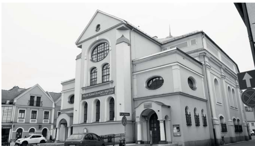
Ryc. 2. Synagoga w Lesznie

Budynek synagogi w Lesznie w obecnej formie to efekt przebudowy osiemnastowiecznych murów w 1905 roku 11 . Bryła wzniesiona została na planie prostokąta, ale towarzyszą jej rozmaite aneksy od stron wschodniej i zachodniej. Główna sala modlitwy, o planie zbliżonym do kwadratu, zajmowała większą część korpusu budowli. Od strony zachodniej z wnętrza bryły wydzielona została garderoba, a nad nią umieszczono babiniec. Pozostałe babiniec – północny i południowy – oparto na filarach. Przekrój sklepienia pozornego jest koszowy, w układzie kolebkowo-krzyżowym z lunetami na okna. Wystrój wnętrz zaprojektowano jako jednolity – polichromie oraz gzymsy utrzymano w spójnej tonacji kolorystycznej oraz z wykorzystaniem secesyjnych motywów roślinnych. W 1905 roku do głównej bryły od ulicy Narutowicza dobudowano aneks wieżowy.