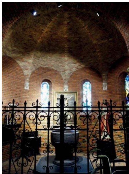
Ryc. 5. Dawna kaplica boczna

Przykład w Vught, a szczególnie sposób zarządzania i projektowanie z szacunkiem do zabytkowej tkanki i funkcji sakralnej obiektu, staje się wzorowym przykładem dla innych parafii, borykających się z tym problemem. Miasto Vught zyskało możliwość wyróżnienia się wśród innych miast, przyciągnięcia inwestorów i turystów, co dobrze wpływa na gospodarkę miasta w czasach kapitalizmu i globalizacji.