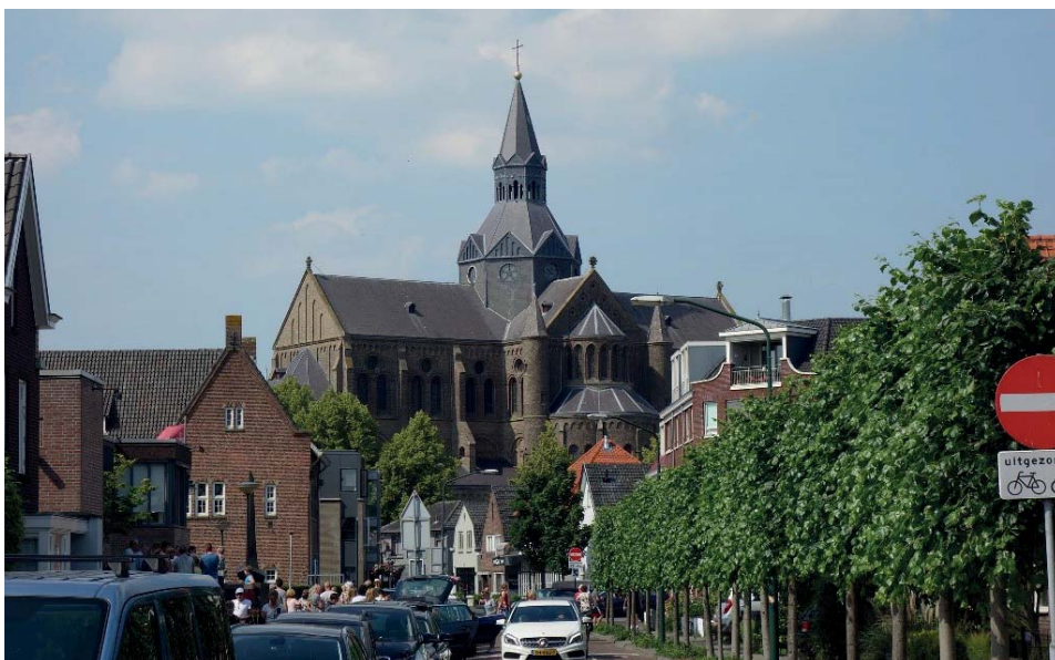
Ryc. 1. Widok z perspektywy ulicy

Taki model zarządzania jest niezwykle interesujący zwłaszcza przy adaptacji dawnych obiektów sakralnych na inne cele niż sakralne. Zaletą tego modelu jest to, że prawny właściciel (administracja kościelna) ma kontrolę nad gruntem i budynkiem. Po upływie 50 lat, jeżeli będzie taka potrzeba, władze kościelne mogą zdecydować i przeznaczyć cały budynek na funkcje liturgiczne. Spółka DePetrus BV może wynajmując część pomieszczeń do celów edukacyjnych, społeczno-kulturalnych lub biurowych, w sposób niesprzeczny ze stanowiskiem administracji kościelnej. Fundacja DePetrus z ramienia spółki DePetrus BV i gminy Vught promuje działalność najemców (między innymi Vughts Museum, sklepu Wereldwinkel sprzedającego produkty Fair Trade z krajów trzeciego świata, instytucje kulturalne MIK i biblioteki). Niewiele jest kościołów, które byłyby zarządzane w taki sposób. Sprawia to, że DePetrus jest zawsze w centrum życia kulturalnego i towarzyskiego, stając się wizytówką Vught.