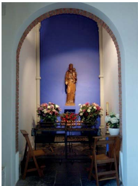
Ryc. 4. Kaplica NMP Fot. autorki 2019.

Zgodnie ze stanowiskiem zarządu kościelnego w kruchcie kościoła powstała kapliczka NMP, która jest zawsze otwarta dla wiernych, gdzie można się pomodlić i zapalić świeczkę. W kaplicy bocznej przedstawione zostały elementy kultu religijnego dawnego kościoła, w tym zabytkowa chrzcielnica i rzeźba Chrystusa. Również na wystawie w muzeum można obejrzeć stare płyty nagrobkowe i inne cenne eksponaty sakralne.