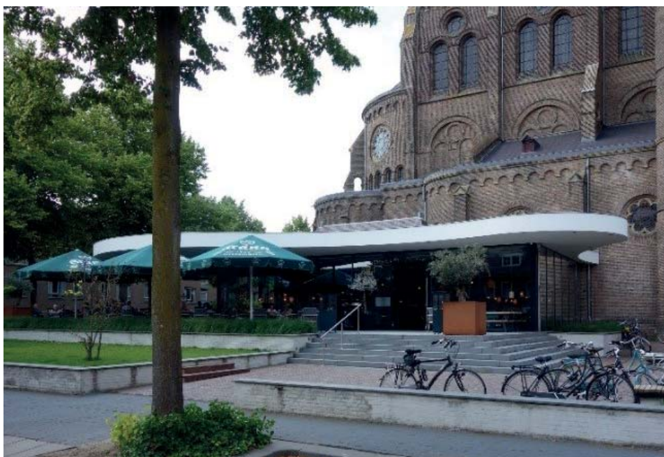
Ryc. 3. Pawilon restauracyjny fot. autorki 2019.