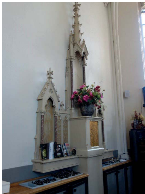
Ryc. 7. Dawny ołtarz boczny, a obecnie miejsce na przechowywanie sztuców Fot. autorki 2019.

Wyżej wymienione fakty adaptacji wnętrz skłaniają do refleksji: czy przy zachowaniu wystroju wnętrz dawnego kościoła i wprowadzeniu nowej funkcji komercyjnej nie dochodzi do profanacji miejsca szczególnie religijnego?. Mimo dobrej myśli i chęci właścicieli zachowania obiektu dla wsi, by stał się ogólnodostępnym, zapomniano, że było to miejsce święte. Zgodnie z KPK Kan. 1238 § 2. Przez przeznaczenie kościoła lub innego miejsca świętego do celów świeckich, ołtarze tak stałe, jak i przenośne nie tracą poświęcenia lub błogosławieństwa. Kanon 1239 § 1. wskazuje, że ołtarz, zarówno stały, jak i przenośny, winien być zarezerwowany tylko do kultu Bożego, z całkowitym wyłączeniem użytku świeckiego. Z tych zapisów wynika, że jeżeli ołtarz stały pozostaje, to winien być przeznaczony wyłącznie do kultu Bożego. Co jest sprzeczne z przeznaczeniem ołtarza jako stołu kuchennego.