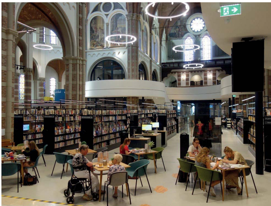
Ryc. 2. Widok wewnątrz w kierunku wejścia 2019.