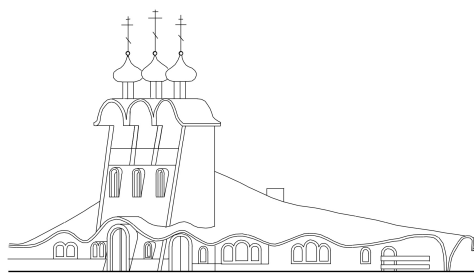
Rys. 4. Jałówka. Dzwonnica Fig. 4. Jałówka. A campanile

Wnętrze nawy jałowskiej świątyni ma charakter centralny, jest skupione wokół potężnego, dominującego centrum kopułowego. Narteks został dość zręcznie wycięty w zachodnim ramieniu tetrakonchy i znajduje się pod płytą chóru. Świątynia jest dość jasna (choć nieprzesadnie). Miejszem największego natężenia światła jest przestrzeń podkopułowa, doświetlona otworami okiennymi w bębnie. Poza tym przestrzeń nawy doświetlają kanonicznie wykonane witraże Chrystusa i Apostołów (z prawej strony) oraz witraż Bogurodzicy i świętych prawosławnych (ze strony lewej). W części prezbiterialnej znajdują się witraże świętej Eufrozyny Połockiej i Aleksandra Newskiego, doświetlające zgodnie z kanonem część prezbiterialną. W późnych latach sześćdziesiątych wnętrze cerkwi zostało wzbogacone polichromiami profesora Józefa Łotowskiego [1]. Cztery potężne żelbetowe słupy, pochylone do środka ku górze zawierają obszerne wnęki (apsydiole), które nadają im lekkości, choć także wpływają na odbiór kształtu wnętrza, zbliżając go nieco charakterem do świątyń ormiańskich. Zakończenia słupów w postaci pendentywów, płynnie przechodzące w zwężający się bęben kopuły są silnymi elementami współtworzącymi wnętrze, podobnie jak tradycyjne, skrzyżowane kolebki o regularnych krzywiznach. Solea zaprojektowana została dookolnie, z zaznaczoną wyraźnie półkolistą amboną i klirosami.