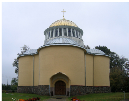
Rys. 3. Jałówka. Widok cerkwi Fig. 3. Jałówka. A view of the church