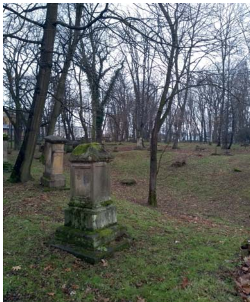
Ryc. 3. Widok na Stary Cmentarz w Krośnie

Spożywają na nim najznamienitsi obywatele miasta. Zachowały się księgi zmarłych, które można znaleźć opublikowane w Internecie. Informacje dotyczące historii cmentarza są trudno dostępne, zaś cmentarz nie posiada monografii. Społeczną opiekę nad cmentarzem sprawuje Komitet Ratowania Starego Cmentarza 18 , który niestety nie posiada nawet strony internetowej.