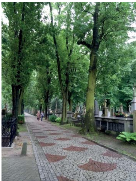
Ryc. 4. Widok na główną aleję, Stary Cmentarz w Tarnobrzegu