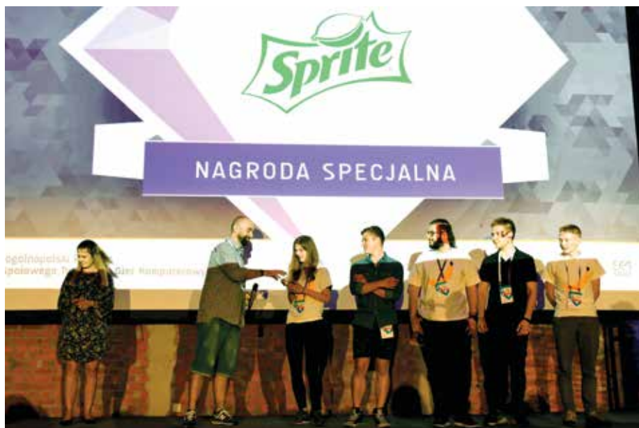
Poza nagrodami głównymi w kategoriach konkursowych, partnerzy i sponsorzy przyznali nagrody specjalne

Projekty studentów oceniali jurorzy z ponad 50 firm, zajmujących się tworzeniem i produkcją gier komputerowych. Byli wśród nich sponsorzy konkursu: Sprite , Techland , CDProject RED , Teyon , Ten Square Games , SuperHot , 11bit Studios , Arifex Mundi , ARP Games , Wastelands Interactive , The Farm51 , Roboto oraz partnerzy: AMD , Infinity Ward , Promised Land Art Festival , Wacom , Hyperbook , Potęga Obrazu , CI Games , Digital Dragons , Game Industry Conference , Międzynarodowy Festiwal Komiksu i Gier w Łodzi , Fundacja Indie Games Polska , Poznań Game Arena , Spidor , galeria Bilbio-Art .