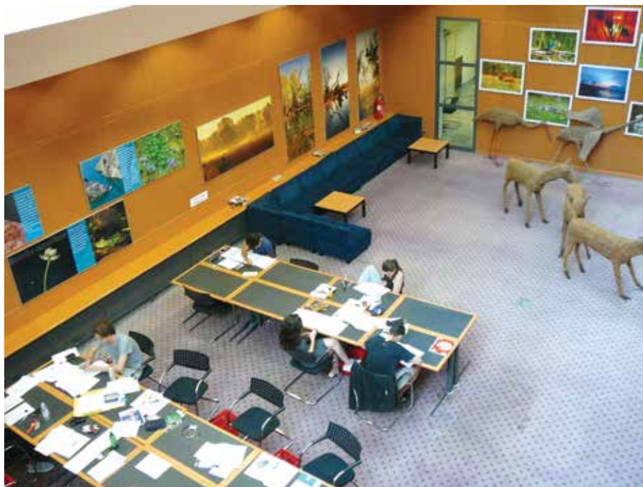
Galeria jako miejsce nauki w Bibliotece Narodowej i Uniwersyteckiej w Zagrzebiu

Program edukacyjny w Chorwacji przybliżył polskim bibliotekarzom działalność i warunki pracy w wybranych bibliotekach szkolnych, miejskich i naukowych w tym kraju.