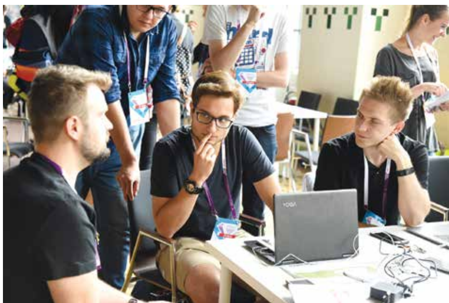
Do finału weszły po trzy zespoły w każdej kategorii konkursowej