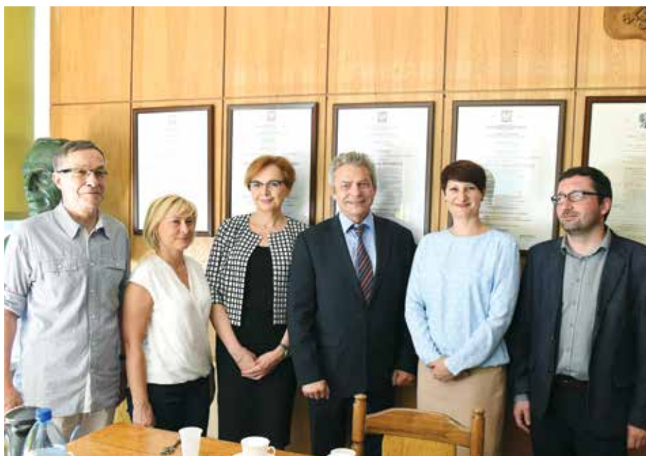
Partnerzy projektu z GOŚ oraz z Wydziału BAIŚ

Politechnika Łódzka i Grupowa Oczyszczalnia Ścieków w Łodzi rozpoczynają współpracę, dotyczącą opracowania systemu monitoringu, wczesnego ostrzegania i zrównoważonego zarządzania dla oczyszczalni ścieków.