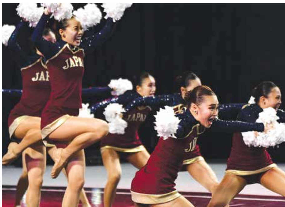
Występy reprezentacji Japonii wzbudziły zachwyt jurorów i widzów