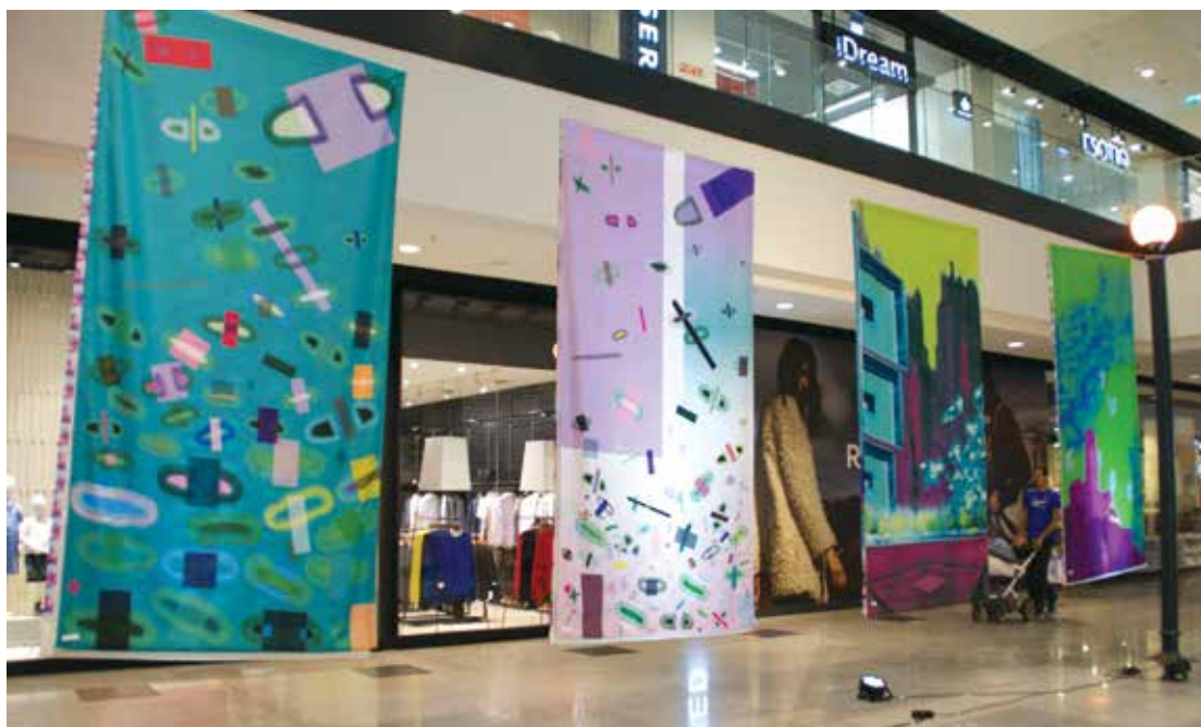
Wystawa drukowanych tkanin