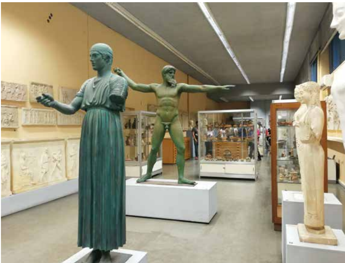
Muzeum w Uniwersytecie Arystotelesa