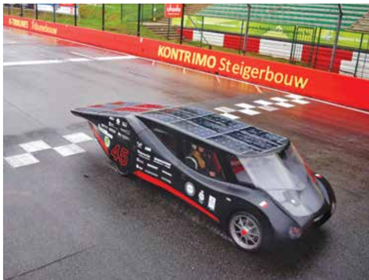
Eagle Two na mecie