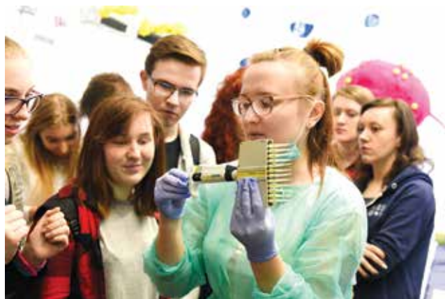
Ścieżka edukacyjna „Z chemią zmieniamy Łódź” (fot. J. Szabela)