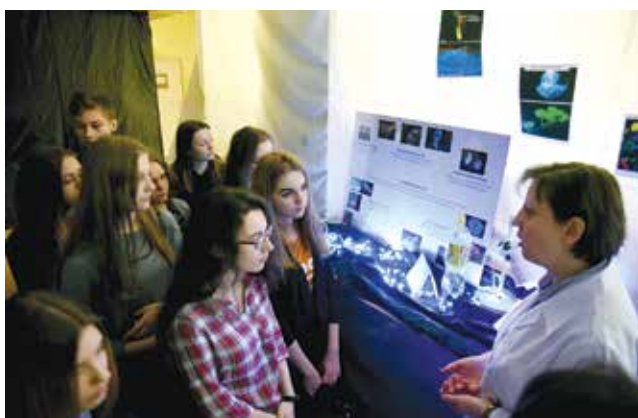
Ścieżka edukacyjna „Z chemią zmieniamy Łódź”