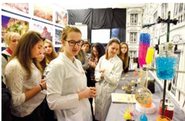
Ścieżka edukacyjna „Z chemią zmieniamy Łódź”