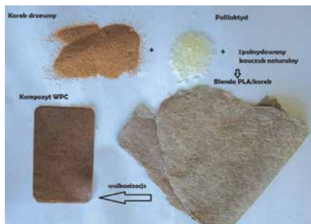
Fot. 3. Napełniacz z korka, kompozyty PLA z korkiem