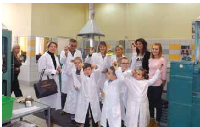
Fot. 2. Sporządzanie mieszanek elastomerowych oraz wulkanizacja piłeczek kauczukowych