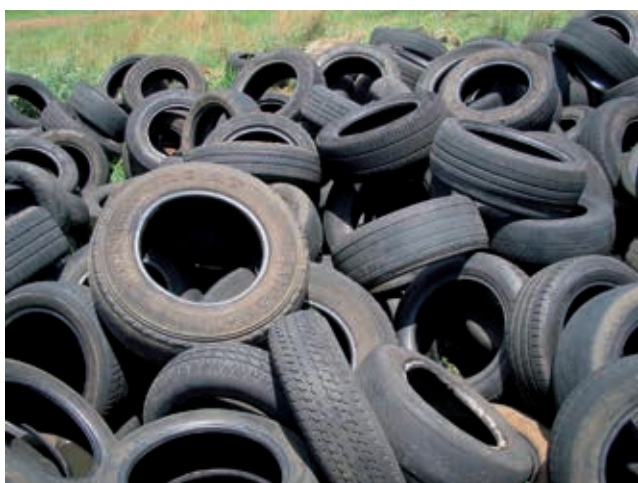
Fot.1. Składowisko zużytych opon [5]

Opony po zakończeniu okresu użytkowania stanowią odpad wymagający zagospodarowania, co nastęrcza wiele trudności. Zużyte opony oraz dętki samochodowe nie ulegają biodegradacji ani nie rozpuszczają się w rozpuszczalnikach organicznych. Ze względu na swoją trwałość i znaczące ilości zostały zakwalifikowane do kategorii odpadów, które powinny być wykorzystywane przemysłowo. Obecnie na świecie w praktyce stosowanych jest zaledwie kilka metod zagospodarowania zużytych opon. Do najważniejszych należy: przedłużenie czasu ich użytkowania poprzez bieżnikowanie, recykling materiałowy, piroliza oraz odzysk energetyczny [3, 4].