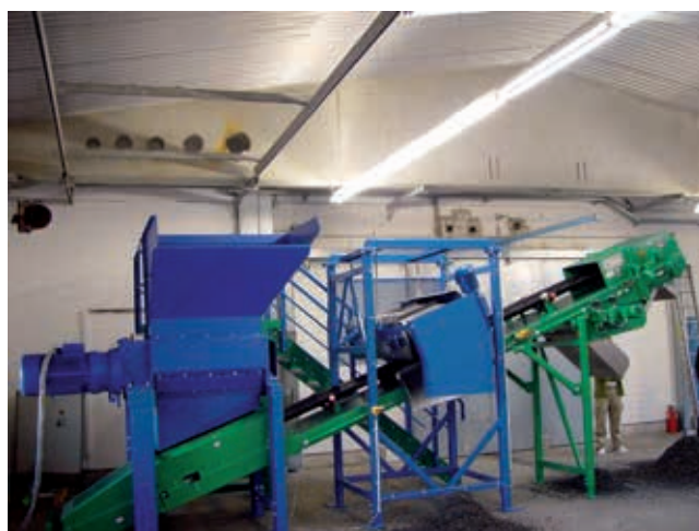
Fot. 3. Linia do rozdrabniania opon samochodowych [9]

Rozdrabnianie metodą Berstorffa polega na ulepszeniu procesu rozdrabniania mechanicznego dzięki wstępnemu rozcieraniu rozdrobnionej gumy za pomocą walcarki lub wyłuszczarki dwuślimakowej. Otrzymany miął charakteryzuje się małą wielkością cząstek i dość silnie rozwiniętą powierzchnią [4, 6].