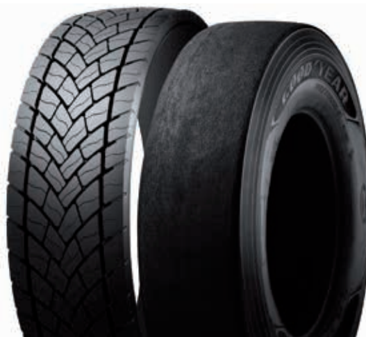
Fot. 2. Bieżnik i karkas [8]

opony. Natomiast sporym ograniczeniem jest konieczność stosowania oddzielnych form do każdego rozmiaru opony i wzoru bieżnika, co wymaga dużych nakładów inwestycyjnych [4, 6-7]. Druga metoda, tzw. na zimno, polega na nałożeniu na przygotowany karkas cienkiej warstwy kleju oraz amortyzującej warstwy mieszanki kauczukowej. Następnie tak przygotowany karkas ulega połączeniu poprzez docisk za pomocą specjalnych kopert gumowych z wytłoczonym i wstępnie zwulkanizowanym bieżnikiem. Produkt poddaje się wulkanizacji w temperaturze ok. 370 K w czasie od 4 do 5 godzin. Metoda ta cieszy się większym zainteresowaniem wśród zakładów bieżnikowania niż metoda na gorąco, ze względu na dość prostą technologię, większe bezpieczeństwo prowadzenia procesu, a także niższe koszty inwestycyjne związane z brakiem konieczności stosowania różnych rozmiarów form wulkanizacyjnych [4, 6-7]. Procesowi bieżnikowania poddawane są opony, których stan techniczny zostaje zakwalifikowany do tego rodzaju regeneracji, przy zastosowaniu specjalistycznych urządzeń. Metoda ta stosowana jest w przypadku opon samochodów ciężarowych, natomiast w przypadku opon samochodów osobowych jest niedopuszczalna za względu na małą grubość bieżnika [3].